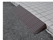
玄関先や庭先の段差