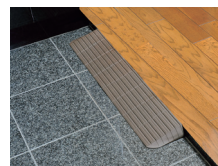
玄関(あがりかまち)の段差