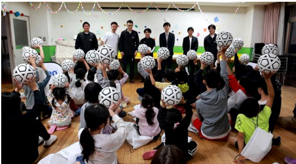
「ひまわり園」で行われたイベントの様子

株式会社モルテン（本社：広島市西区 代表取締役社長：民秋清史、以下、モルテン）は、2025 年夏に公益社団法人日本サッカー協会（JFA）と立ち上げたクラウドファンディング『組み立て式サッカーボールを 1,000 人の子どもたちに届ける！』で集まった支援をもとに、順次日本国内の子どもたちに組み立て式サッカーボール『BALL KIT』を届けます。