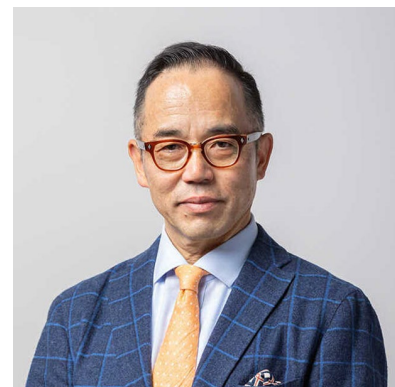
花まる学習会代表 高濱正伸 氏

正確さ、粘り強さ、やり遂げる集中力に加えて、柔軟性、自由に思い描く力・創造力を伸ばすGOAL KITは、プラモデルの価値にさらに粘土遊びや砂遊びの意義を合体させた、新時代の遊びであり学びの機会と言えるであろう。