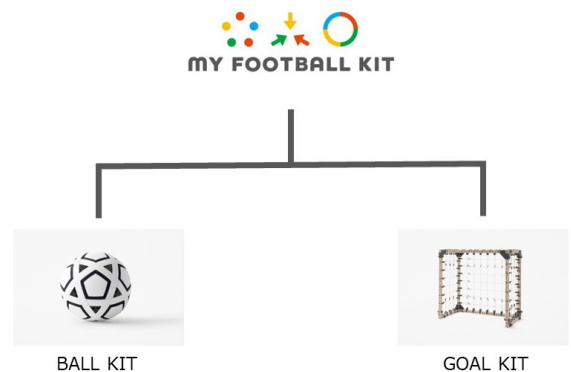
MY FOOTBALL KIT プログラム

すべての子供たちが、体験を通じて学習やスポーツの魅力を感じてもらうことを目的としてつくられました。つくり、遊び、なおす。持続可能な教育の仕組みが子供たちの豊かな思考をつちかっています。