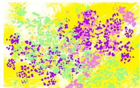
デザインモチーフ