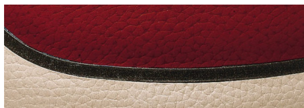
新色の天然皮革・新シボ形状

新色の天然皮革を採用し、チャンネルにも天然皮革と相性の良い色を配しました。さらに新シボ形状と焼印印刷を採用することによって、天然皮革の美しさを引き出しています。