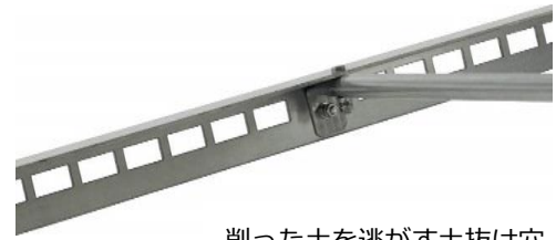
削った土を逃がす土抜け穴

8kgの重量で土をしっかり削り、180cmの幅広さで広い範囲を早くならせませす。削った土はブレードの穴から抜け、土が溜まって重みが増さない構造になっています。土は適度に散らされ、表面をふわっとした状態に仕上げます。