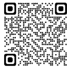
モルテン公式オンラインショップ

モルテンは世界中のトップリーグやチーム、国際大会で使用される公式試合球やスポーツエキップメントなどの革新的製品を生み出し、グローバル・スタンダードとしての品質を高め続けていきます。詳細については、弊社サイトを参照ください。