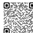
モルテン公式ホームページ