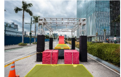
ラバーマット使用箇所イメージ (黄色網掛け部分)