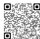
日本オブスタクル協会 公式ホームページ