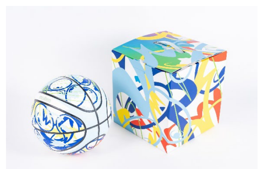
箱にもオリジナルデザインを採用