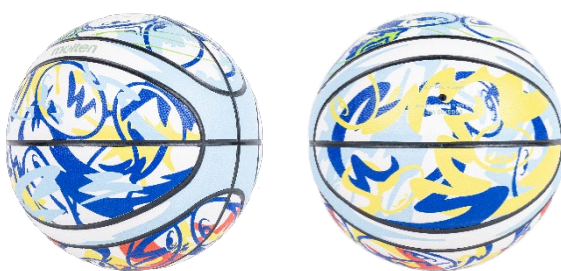
パネルによって異なるデザインをあしらっている